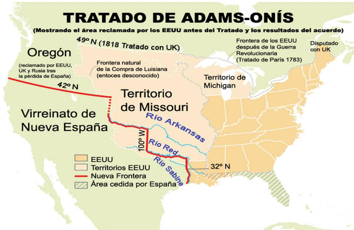
Tratado de Transcontinentalidad de 1819-1821 (Tratado de amistad, arreglo de diferencias y límites entre su Majestad Católica y los Estados Unidos de América, Florida Purchase Treaty, Tratado de La Florida)

controlar el mercado del azúcar. Tras la caída de Cuba se lanzó sobre el resto. Puerto Rico, Guam y Filipinas cayeron sin esfuerzo como un frágil castillo de naipes. Los que acusaban a España de traficante, avasalladora y colonialista, se cobraron su botín, y ahí queda la prueba, en su presencia en el rosario de islas caribeñas hoy en poder, de una u otra manera, de Inglaterra, Francia, Holanda o los propios Estados Unidos, lejos del cumplimiento de aquel grito de "América para los americanos".